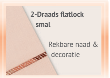
2-Draads flatlock smal Rekbare naad & decoratie