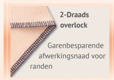
2-Draads overlock Garenbesparende afwerkingsnaad voor randen