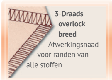
3-Draads overlock breed Afwerkingsnaad voor randen van alle stoffen