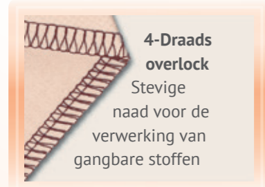
4-Draads overlock Stevige naad voor de verwerking van gangbare stoffen