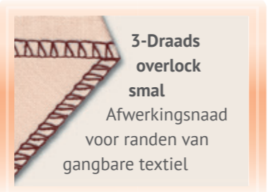
3-Draads overlock smal Afwerkingsnaad voor randen van gangbare textiel