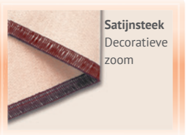
Satijnsteek Decoratieve zoom