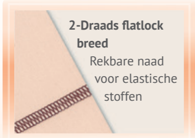
2-Draads flatlock breed Rekbare naad voor elastische stoffen