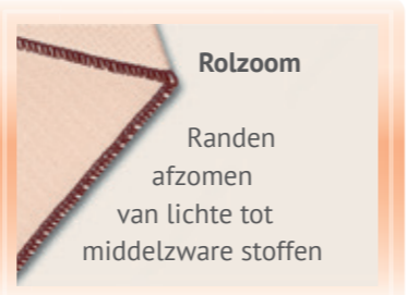
Rolzoom Randen afzomen van lichte tot middelzware stoffen